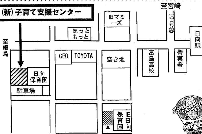
(旧) 子育て支援センター